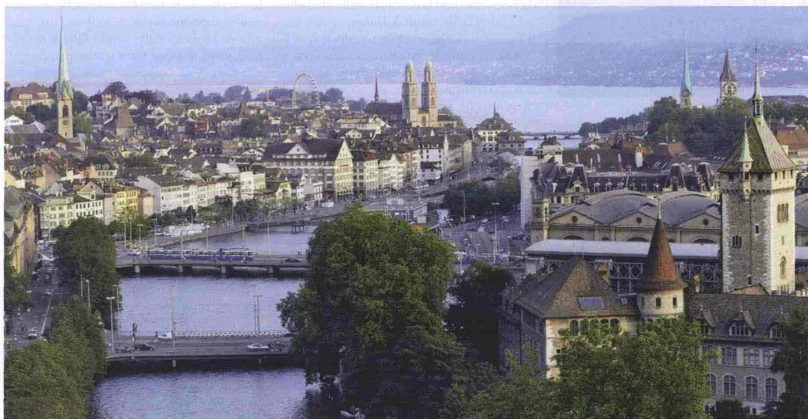
Un panorama di Zurigo, nel punto in cui il fiume Limmat si immette nel lago che porta il nome della città