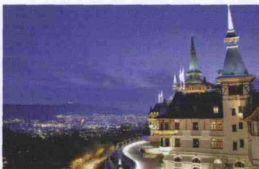
The Dolder Grand