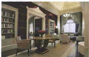
La sala lettura