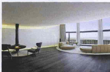
La suite Carezza