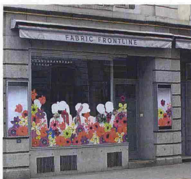
Fabric Frontline, Bahnhofstrasse