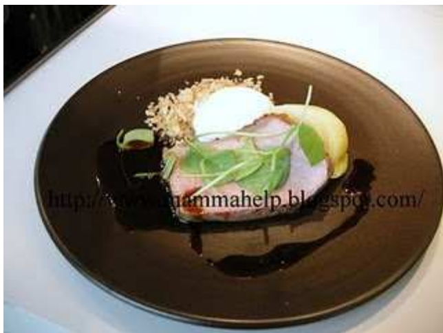
Sella di vitello di Ennetburger con spuma di Gruyère, indivia belga, salsa di cipolla e timo