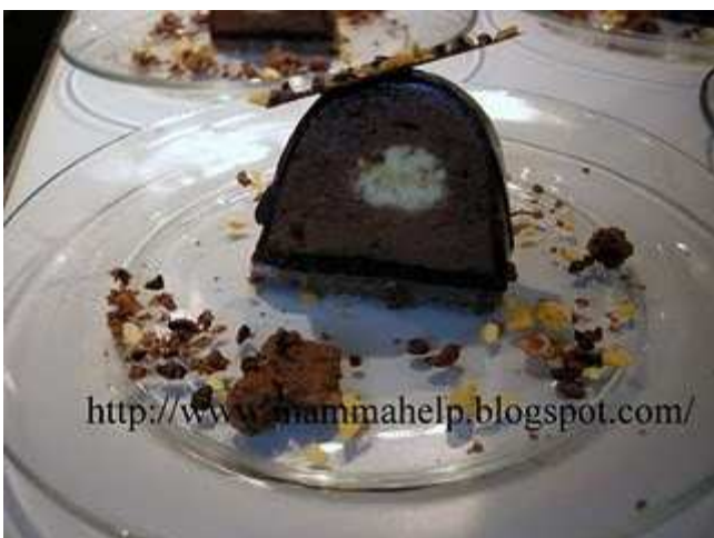
Dolce al cioccolato e maracuja