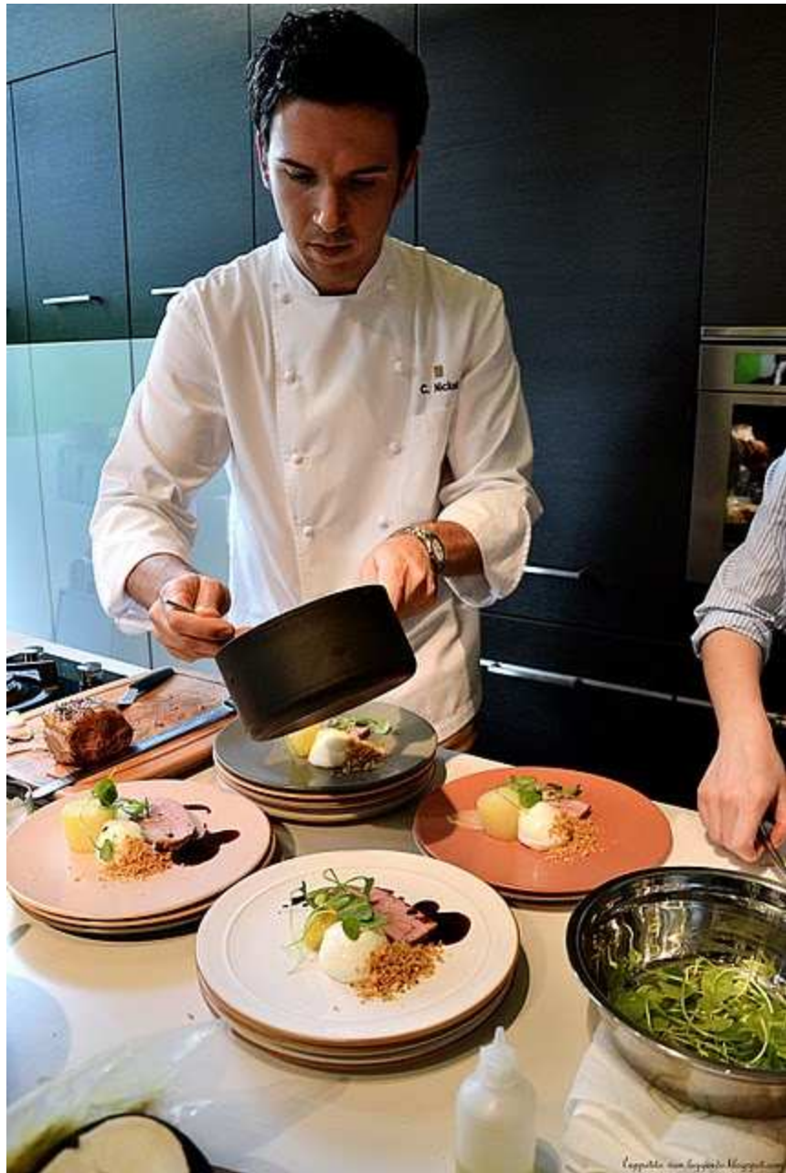
L'opere con l'opere di Michel