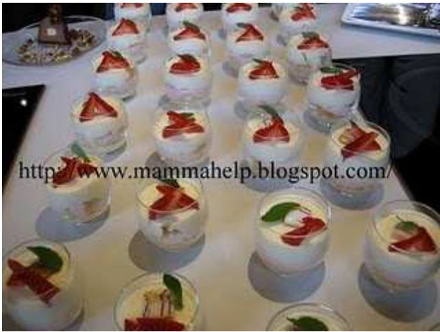
Millefoglie alla crema di fragole