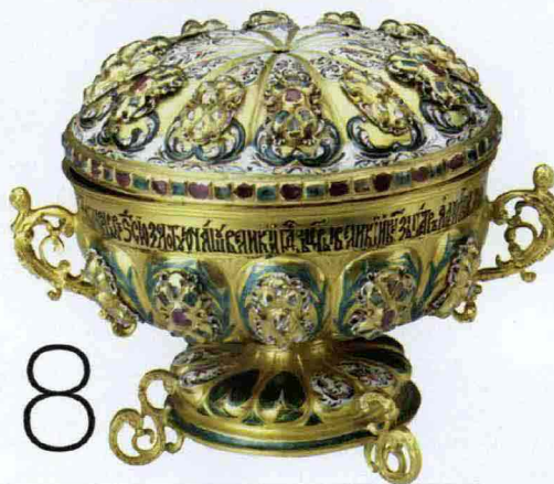
FIRENZE Il tesoro del Cremlino