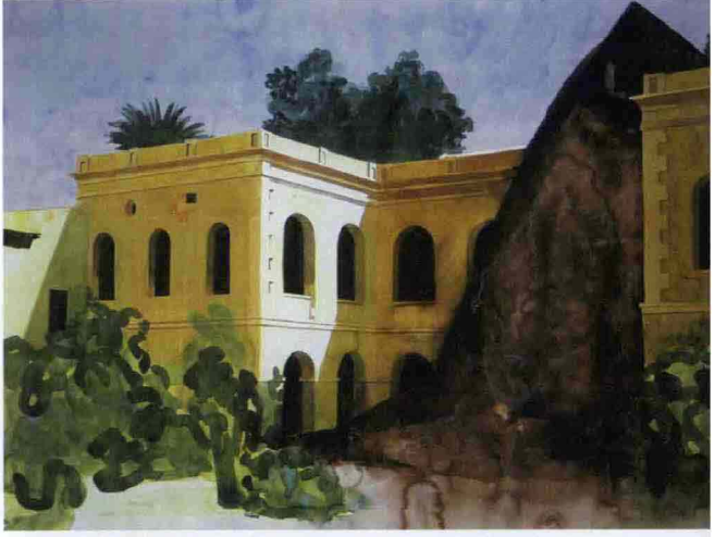
4 ACIREALE Yvan Salomone