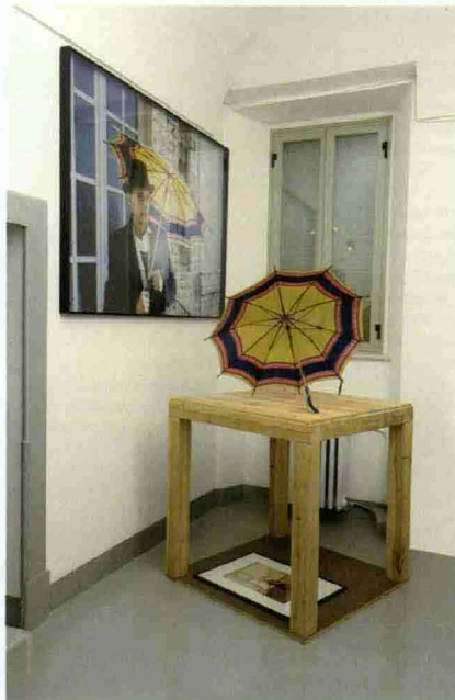
ZURIGO Joseph Beuys

MILANO MIA Milan Image Art Un nuovo ambizioso progetto vede protagoniste la fotografia e la videoarte. Si tratta di una grande fiera, interamente dedicata a due settori che, negli ultimi