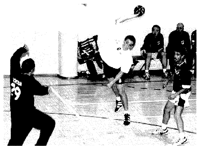
Una buona prestazione non è bastata ai biellesi per evitare il ko

Una pallamano di buona qualità non basta all'Hc Biella per aver la meglio sulla compagine torinese del Città Giardino. Per il campionato di serie B maschile, alla palestra di Verrone la seconda forza della classe è riuscita a spuntarla per 21-24. Sono i torinesi a passare subito avanti, ma Biella ribatte colpo su colpo. Tutto il primo tempo vive su una perfetta parità, con Città Giardino sempre in testa e Biella che segue, tranne in una circostanza in cui si invertono le parti. Se i lanieri avevano nella difesa il loro punto debole, cancellano con questa prestazione ogni dubbio. Il