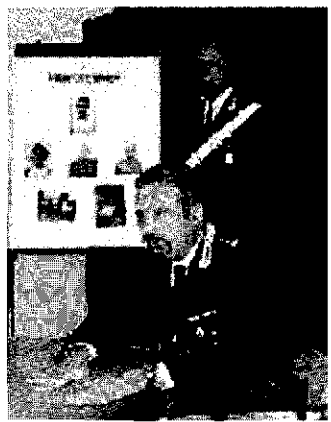
L'operazione dei carabinieri