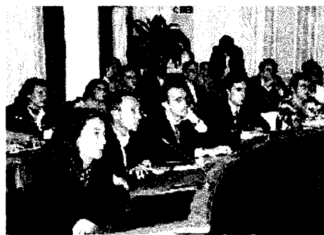
Un momento dell'incontro a Palazzo Oropa