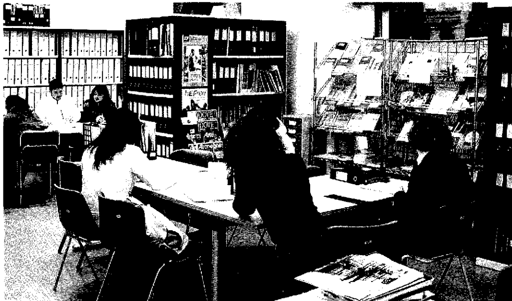
Gli uffici dell'Informagiovani, dove si possono trovare tutti i bandi di concorso

Il Gruppo Marchi&Fildi acquisisce il marchio francese Badin Sartel Sas. L'operazione consolida così la politica di crescita e di potenziamento commerciale dell'azienda biellese soprattutto in riferimento alla linea di filati indirizzata principalmente alla tessitura circolare. In forza dell'accordo stipulato, la linea di prodotti principale di Badin Sartel (100% viscosa melange e mischie viscosa con fibre metallizzate), il know-how e la tecnologia produttiva nonché alcuni specifici impianti destinati alla realizzazione del prodotto, saranno acquisiti da Marchi&Fildi assicurando sin da subito la continuità del servizio, della qualità e della produzione che caratterizzano la celebre azienda di Barentin, nel dipartimento della Seine Maritime, pezzo storico del tessile francese essendo già operativa dalla prima metà dell'Ottocento.