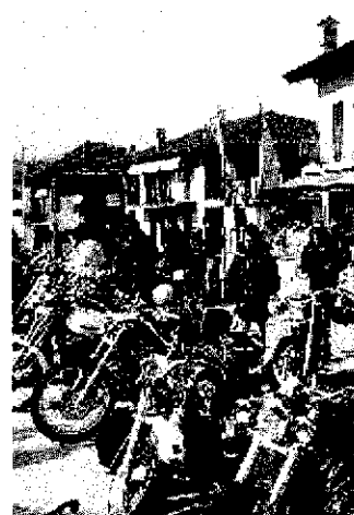
Il «mito» della Harley